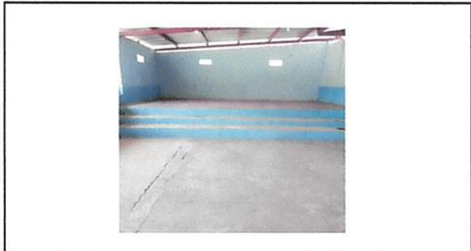
Escenario que tambien será remozaco colocandole piso de granito.