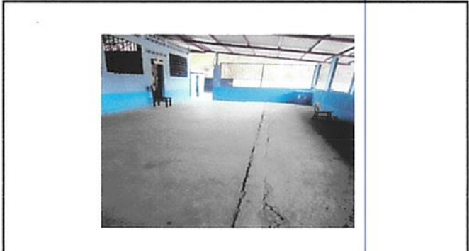
mismo corredor visto de la entrada a la escuela para ver el largo del mismo todo llevará piso de granito.