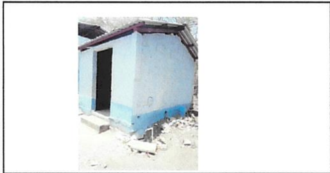
Vista lateral de cocina que se ampliará y que en su interior llevará, estufa rural completa, pila con dos lavaderos, meson con divisiones, instalación eléctrica.