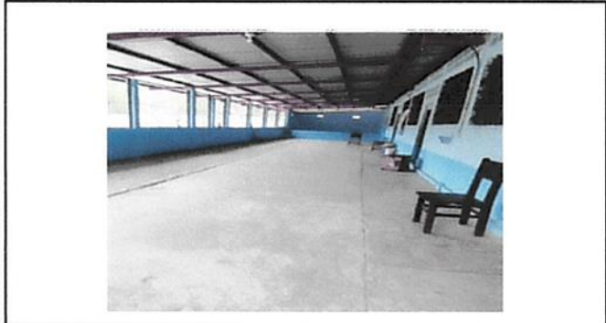
Corredor visto de fondo que se remozara colocandole piso de granito.