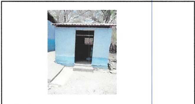
Vista de frente de la cocina que se remozará.